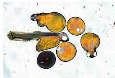
↑ Œufs de truite après 21 jours de la fécondation.

La fécondation aboutit à la formation d'un millier d'œufs. Dans ces œufs se développent les futurs alevins. Les œufs sont pauvres en réserve, par conséquent le développement des alevins dans l'œuf doit être rapide : il dure quelques jours seulement.